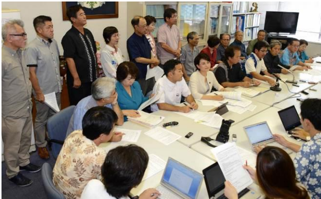
ずらっと並んだ県議のみなさん。沖縄の仲間から写真が…

12日、沖縄県議会と与党会派は、6月 立て用材の土砂や石材などの埋め 伴う外来生物の県外からの搬入に る条例案を、県議会事務局に提 出しました。