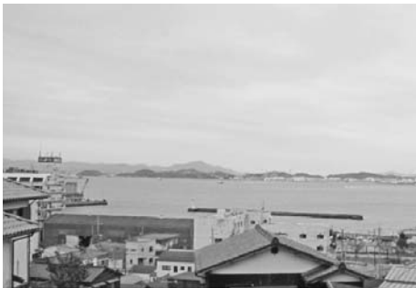
旧泉屋敷跡地から関門海峡を望む

旧門司一帯は、九州の玄関口を司る「門司」と古代官道の駅「社崎駅」を維持するために、多くの雑舎群と従事する人々がいたと推測されています。（つづく）