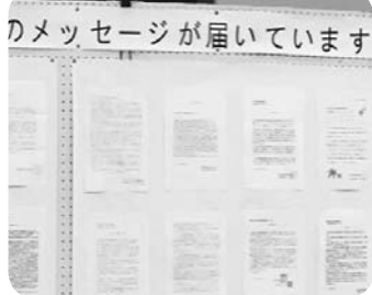
他都市労組からの 激励メッセージ