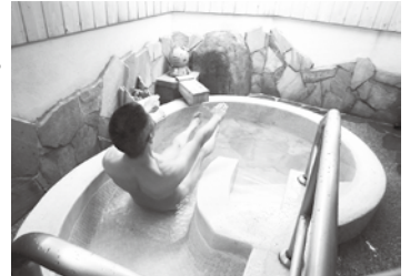
あんまりチビ共がはしゃぐのでワシも滑ってみました。うまく曲がれると楽しい!

「またあゝ温泉行くと?もう飽いたばい。」ついにチビに言われてしまった。ケツと思ったがワシもその昔親父に同じようなことを言った事がある。「また秋芳洞行くと?バカの二つ覚えのごと。」6歳の夏を最後に秋芳洞には連れて行ってもらえんごとなつた。ワシの場合、今後温泉に行かんと言うわけにもいかないので、ちよつと変わった所へ。