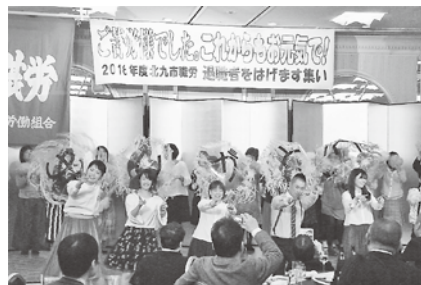
昨年のステージパフォーマンスで「恋ダンス」を披露する保育所部会の仲間