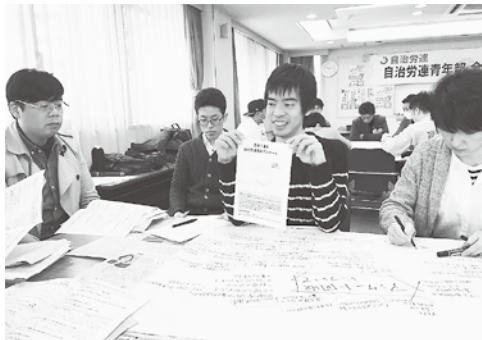
青年部第58回全国委員会の様子

各組織の報告の中で、高知県では、まずは組合員同士が繋がる必要があると思いい、組合員のさらなる団結・結束力の強化を目的に、よさこいプロジェクトを立ち上げたそうです。組合員は「集める」のではなく、「集まる」のだと。「青年なら